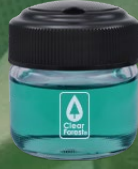
สำหรับวางในรถยนต์