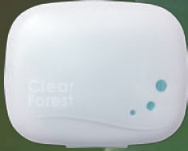
시트 아래 사이드 포켓 타입